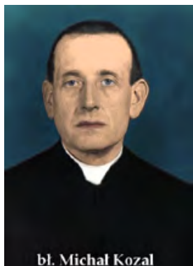
bł. Michał Kozal

„Wątpiący staje się mimowoli, sojusznikiem wroga”. Słowa bł. Michała Kozala, w których lapidarnie ujęty jeden z tragicznych skutków groźnej choroby ducha, jaką jest zwątpienie. Człowiek ciągle musi się zmagać i wielu wrogów czyha na moment jego słabości, na chwilę zwątpienia. W każdym z nas mieszka wiele wad i zwycięstwo nad nimi w wielkiej mierze jest uzależnione od wiary w siebie i w łaskę Bożą. Każda sekunda zwątpienia jest klęską. Człowiek przez swoje „nie potrafię” oddaje się w ręce wady. Jak długo się zмага, tak długo szala zwycięstwa może być przeważona na jego stronę. Gdy w sercu jego zrodzi się zwątpienie, następuje klęska. Wada otrzymuje „sojusznika” i dlatego odnosi zwycięstwo. Podobnie jest z przeciwnościami losu, które jawią się na drodze naszego życia jako przeciwnik utrudniający realizację woli Boga. W obliczu trudności łatwo o zwątpienie i rezygnację nawet z wielkich wartości. Ileż to razy słowa: „To nie dla mnie, to nie na moje możliwości” są głośnym wyznaniem zwątpienia. To ono decyduje o klęsce. Spostrzeżenie bł. Michała Kozala jest aktualne nie tylko w wymiarze jednostkowym, lecz i społecznym.