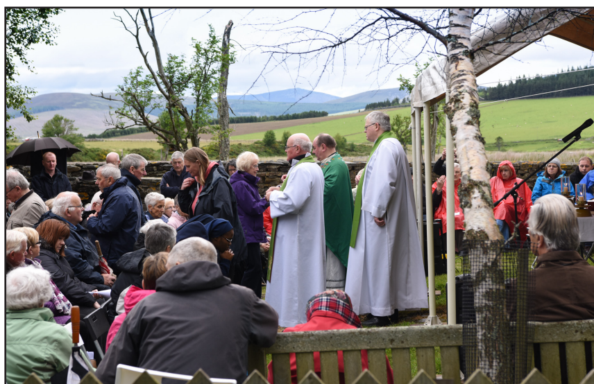
The Old Seminary of Scalan (1717-1799), in the Braes of Glenlivet, is a piece of national history that has been kept alive by the Scalan Association. Chosen for its remote location to keep it hidden from Hanoverian soldiers, Scalan was one of few places where Roman Catholicism survived during the eighteenth century. For a long time Scalan was the only place in Scotland where Catholic priests were trained.