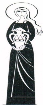
Feastdays this week