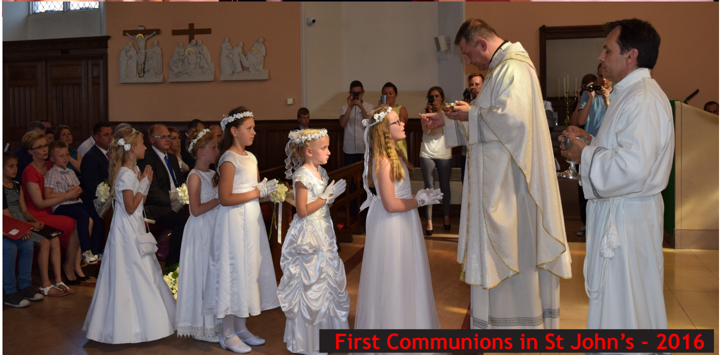
First Communions in St John's - 2016