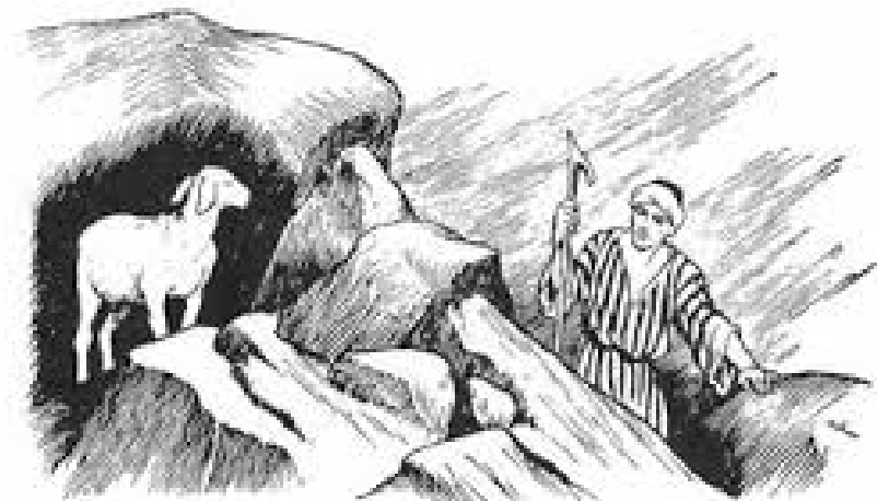
Пастры і аўчарнае стада.

Niedziela „Dobrego Pasterza” najczęściej jest okazją do modlitwy o powołania kapłańskie. W parafiach organizuje się specjalne nabożeństwa i akcje. Podejmując ten temat, warto postawić sobie pytanie o Kościół. Pasterz stoi na czele stada. Już w Ewangelii znajdujemy teksty mówiące o tym, że owce słuchają jego głosu. To on przewodzi stadu i jest za nie odpowiedzialny. Jednak przemiany współczesnej religijności idą w takim kierunku, że coraz częściej owce chcą zająć miejsce pasterzy, a bywa, że jednym i drugim brakuje dokładnej wiedzy na temat pastwiska, w którym mają żyć i czuć się bezpiecznie. Po latach naszego osławiania się z demokracją, społeczeństwo stało się jeszcze bardziej roszczeniowe, a z drugiej strony coraz bardziej zatracające swoją wiarę i religijną tożsamość. Wierni coraz częściej chcieliby decydować o wszystkich aspektach kościelnego życia. Niedawno w mediach było głośno o protestach przeciwko przenosinom księży proboszczów. Jednym pomysłem biskupa się podobał, innym przeciwnie. Do spraw administracyjnych i porządkowych dochodzą kwestie doktrynalne. Niektórzy komentują takie czy inne rozstrzygnięcia –