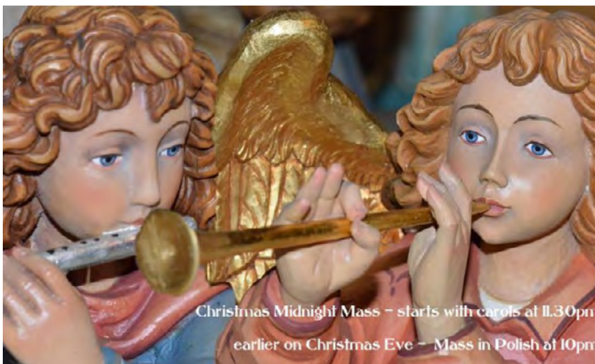
Christmas Midnigh Mass - starts with carols at 11.30pm earlier on Christmas Eve - Mass in Polish at 10pm

There will be a number of priests to hear individual confessions after a time of Reflection which begins at 7pm on Monday, 21st December