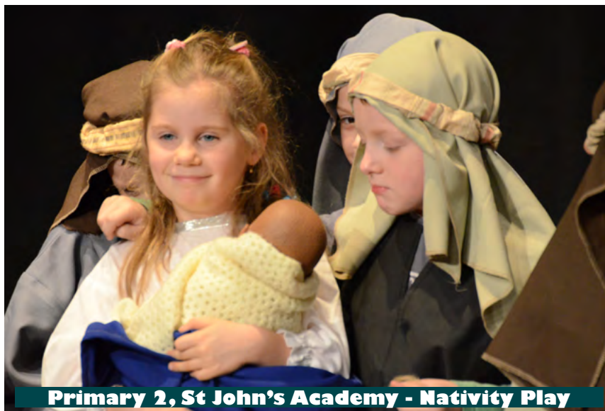
Primary 2, St John's Academy - Nativity Play