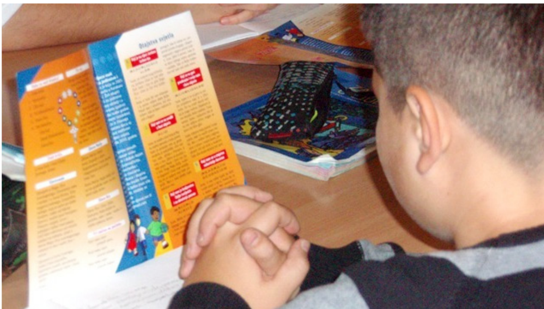
This boy in Trnava (Croatia) is one of the children praying the rosary worldwide.

Each year on 18 October, one million children around the world pray the Holy Rosary. This is an initiative supported and promoted by Aid to the Church in Need. The idea began in Caracas, Venezuela and grew to be a national project of the Venezuelan Church - 'One Million Children Praying the Rosary'.